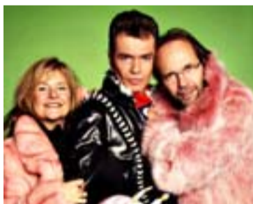
2004: Ole Paus og Elisabeth Andreassen.