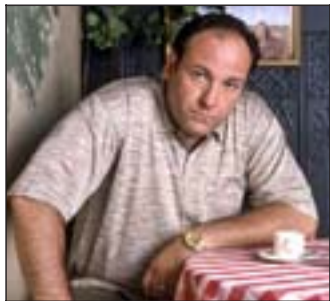
LEDET INVESTORENE: Tony Soprano.

«Sopranos» er USAs mest populære tv-serie gjennom tidene.