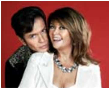
2006: Wenche Myhre